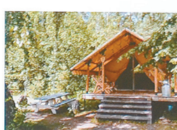
Глэмпинг «Море леса»