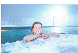
Геотермальный комплекс «Тобольский»