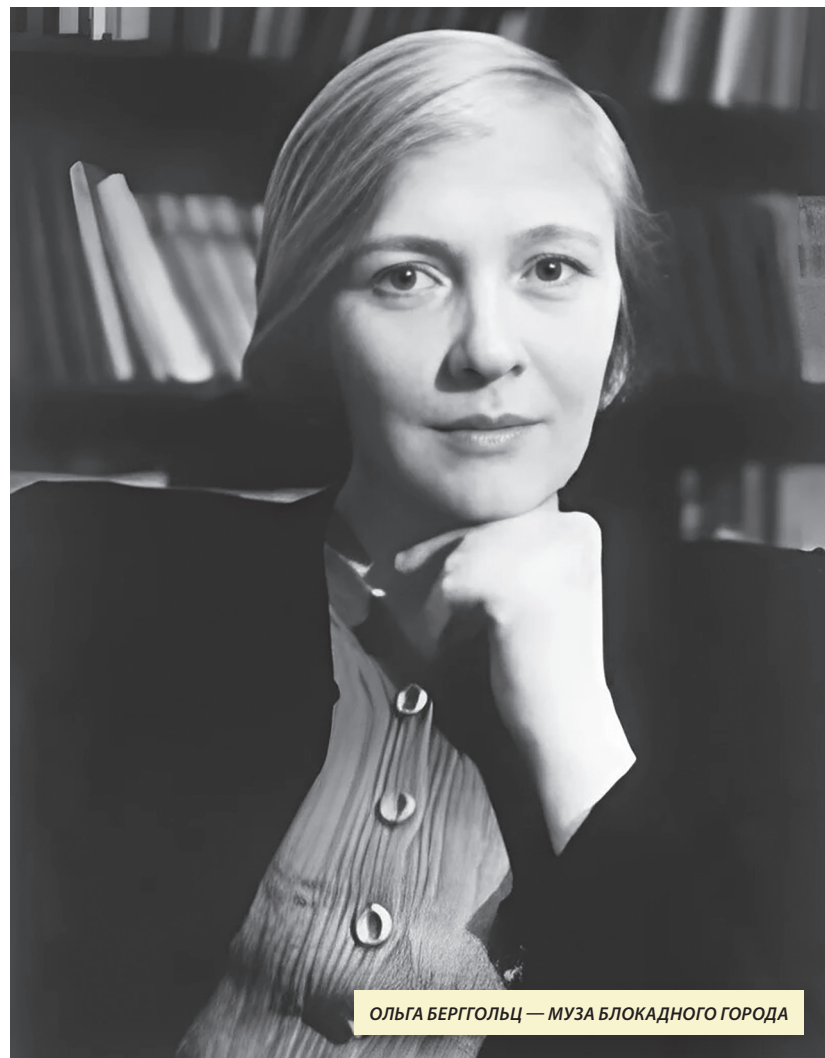
ОЛЬГА БЕРГОЛЬЦ — МУЗА БЛОКАДНОГО ГОРОДА