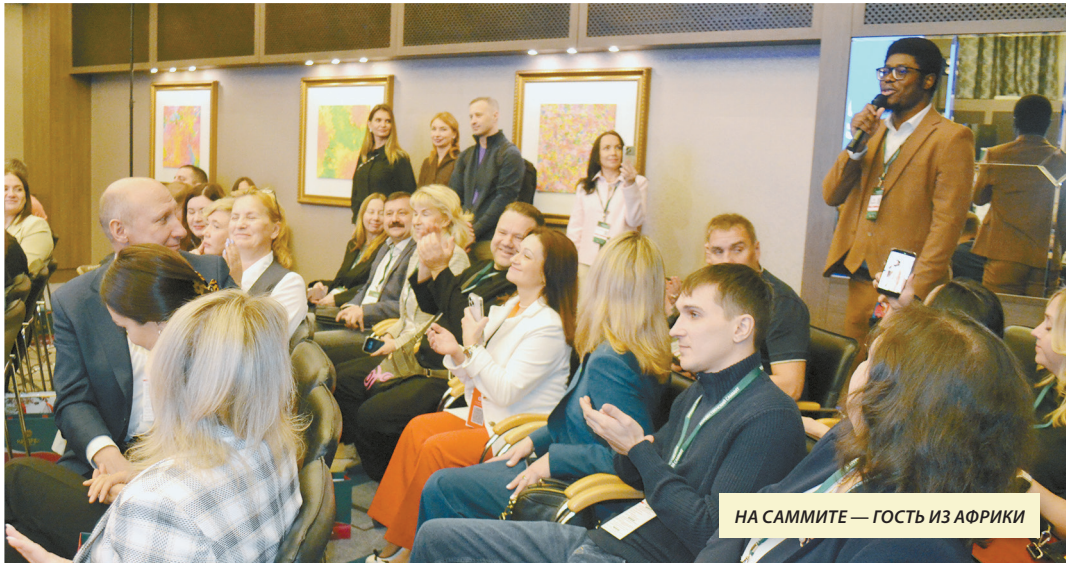
НА САММИТЕ — ГОСТЬ ИЗ АФРИКИ