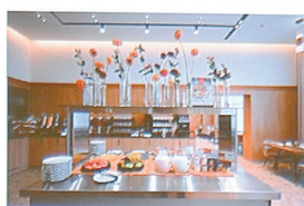
Азимут Тюмень 4*