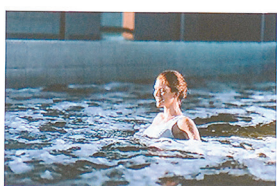
Термальный комплекс «Дубровинский»