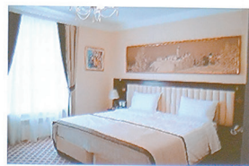
Миррос Отель Тобольск 4*