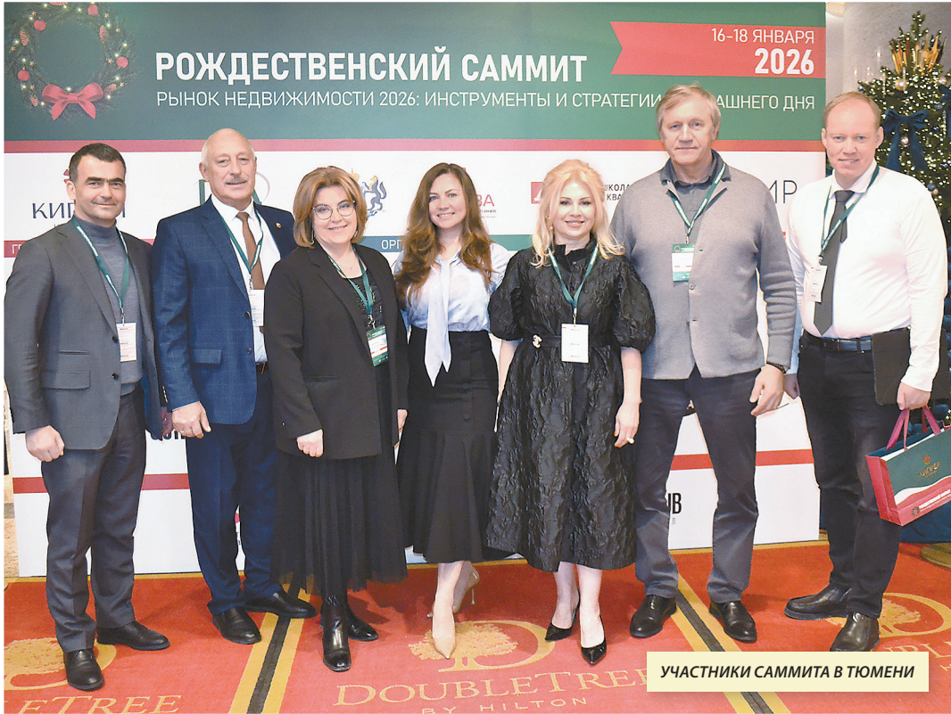
УЧАСТНИКИ САММИТА В ТЮМЕНИ