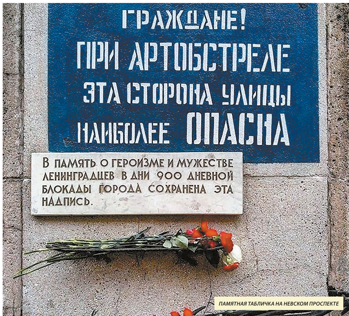
ПАМЯТНАЯ ТАБЛИЧКА НА НЕВСКОМ ПРОСПЕКТЕ