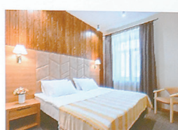
Гостиница Межа 3*