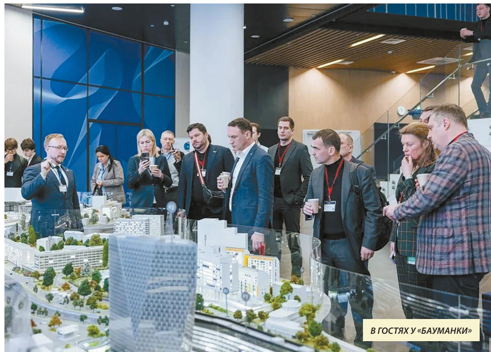
В ГОСТЯХ У «БАУМАНКИ»