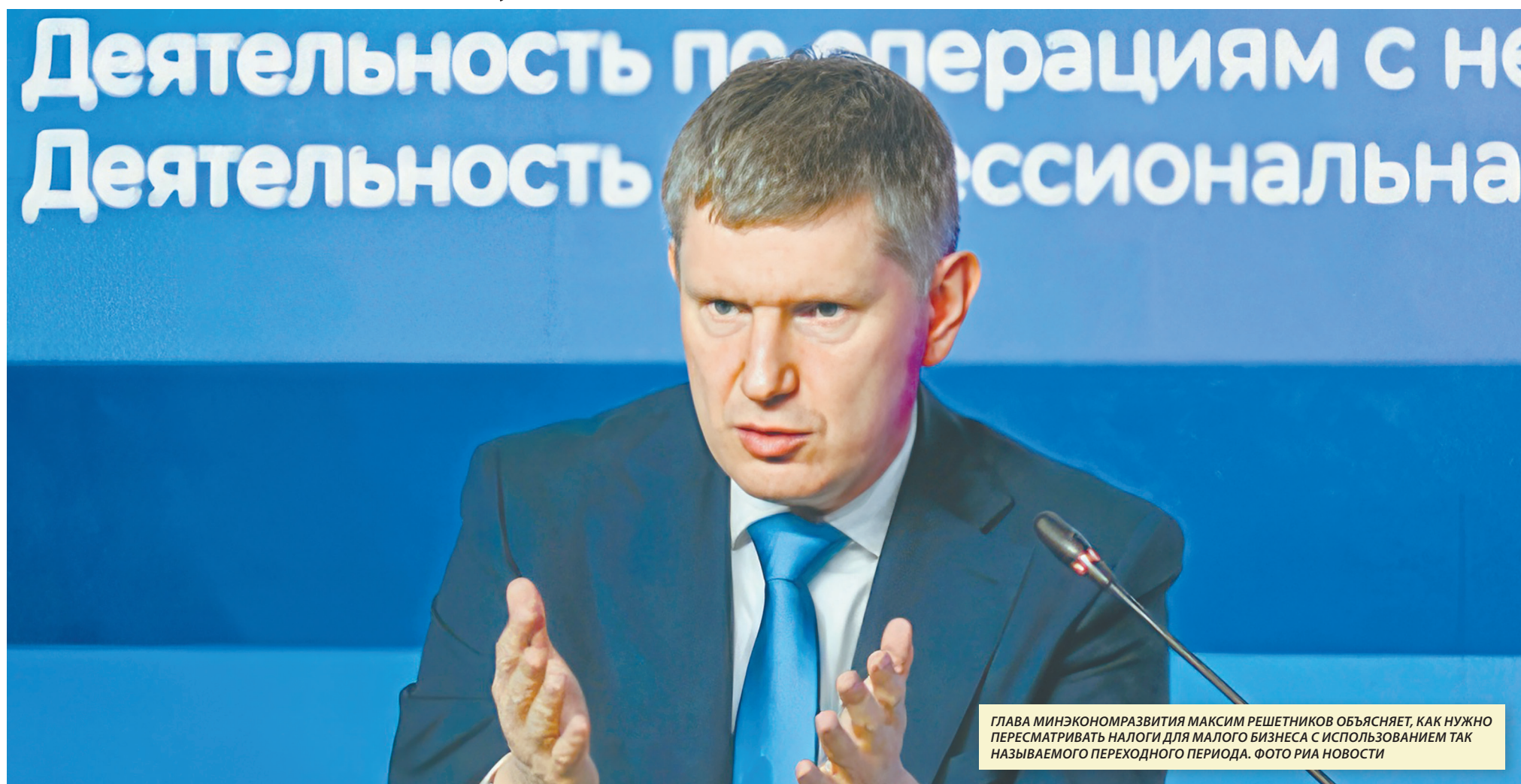
ГЛАВА МИНЭКОНОМРАЗВИТИЯ МАКСИМ РЕШЕТНИКОВ ОБЪЯСНЯЕТ, КАК НУЖНО ПЕРЕСМАТРИВАТЬ НАЛОГИ ДЛЯ МАЛОГО БИЗНЕСА С ИСПОЛЬЗОВАНИЕМ ТАК НАЗЫВАЕМОГО ПЕРЕХОДНОГО ПЕРИОДА.