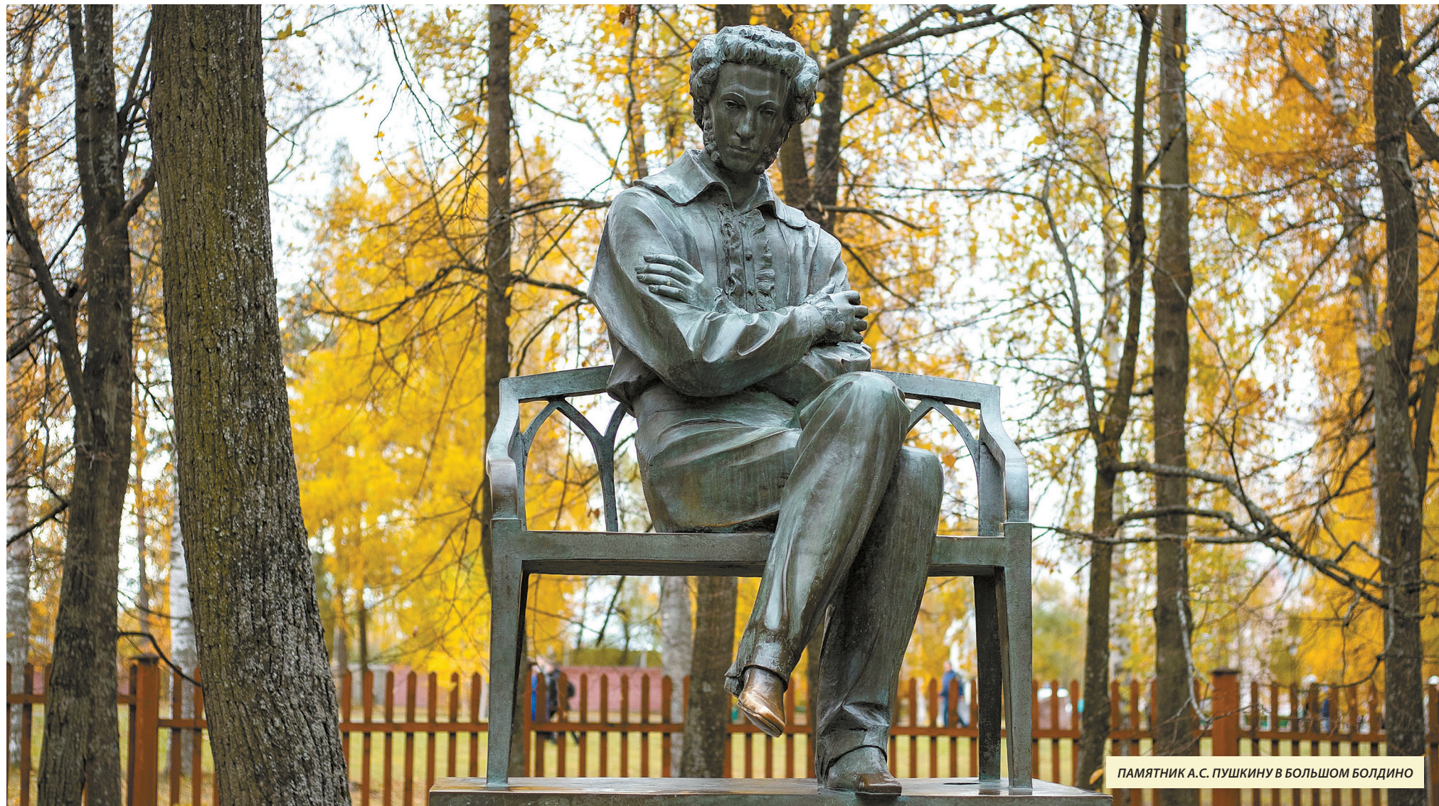
ПАМЯТНИК А.С. ПУШКИНУ В БОЛЬШОМ БОЛДИНО

Десятого февраля 1837 года в 2 часа 45 минут пополудни остановилось сердце поэта. «Угас, как светоч, дивный гений, увял торжественный венок», — напишет о нем другой поэт, тоже погибший в расцвете лет