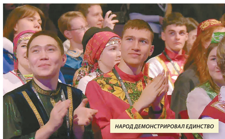
НАРОД ДЕМОСТРИРОВАЛ ЕДИНСТВО