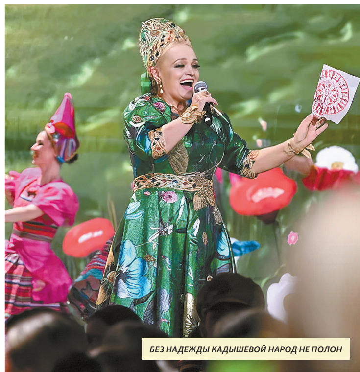
БЕЗ НАДЕЖДЫ КАДЫШЕВОЙ НАРОД НЕ ПОЛОН