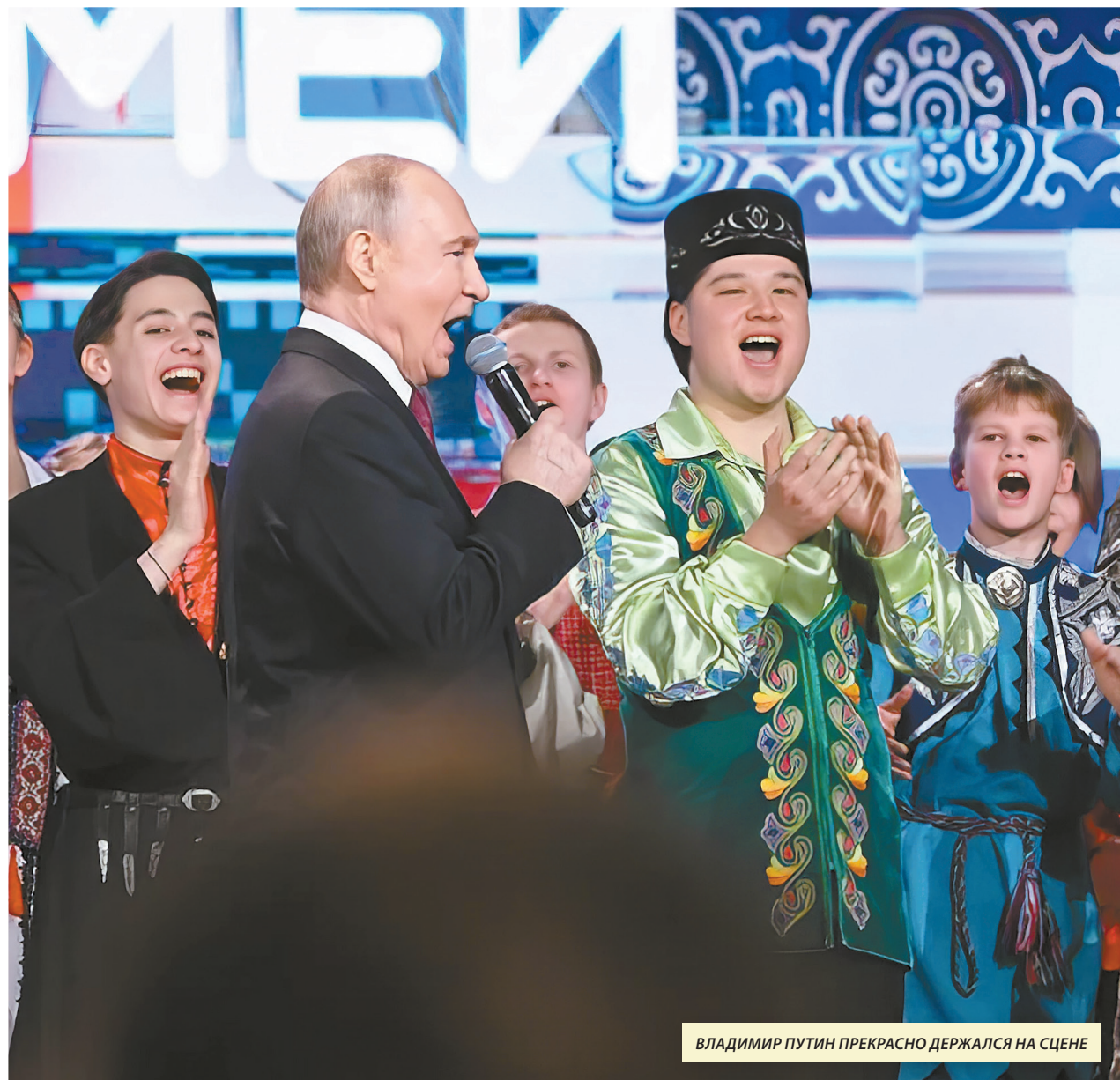
ВЛАДИМИР ПУТИН ПРЕКРАСНО ДЕРЖАЛСЯ НА СЦЕНЕ