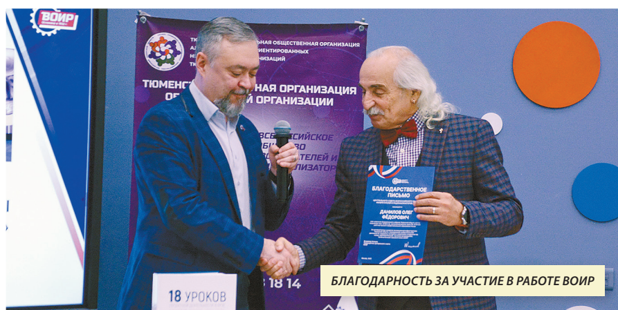
БЛАГОДАРНОСТЬ ЗА УЧАСТИЕ В РАБОТЕ ВОИР