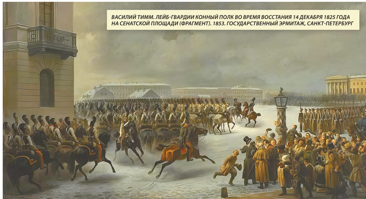
ВАСИЛИЙ ТИММ. ЛЕЙБ-ГВАРДИИ КОННЫЙ ПОЛК ВО ВРЕМЯ ВОССТАНИЯ 14 ДЕКАБРЯ 1825 ГОДА НА СЕНАТСКОЙ ПЛОЩАДИ (ФРАГМЕНТ). 1853. ГОСУДАРСТВЕННЫЙ ЭРМИТАЖ, САНКТ-ПЕТЕРБУРГ