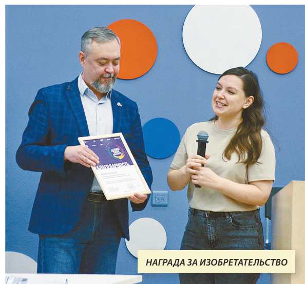
НАГРАДА ЗА ИЗОБРЕТАТЕЛЬСТВО