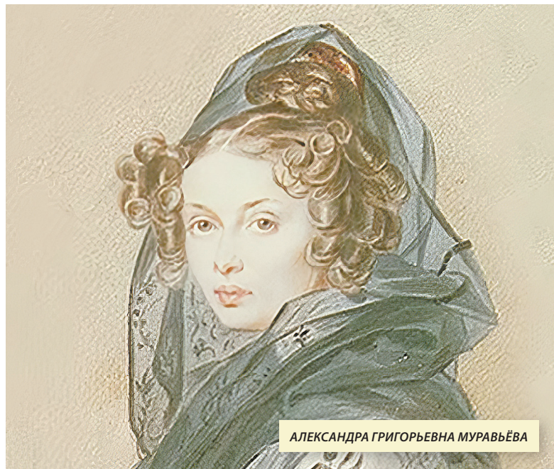
АЛЕКСАНДРА ГРИГОРЬЕВНА МУРАВЬЕВА

В этом году исполнится 200 лет одному из самых драматичных и знаковых событий отечественной истории — восстанию декабристов. В российской общественно-политической мысли и культурной памяти оно неизменно подвергалось переосмыслению, но никогда — забвению. Их восстание, пусть и неудавшееся, вписывалось в парадигму прогрессивного развития России как предвестие светлого будущего. Портал «Культура РФ» предлагает вспомнить, как это было