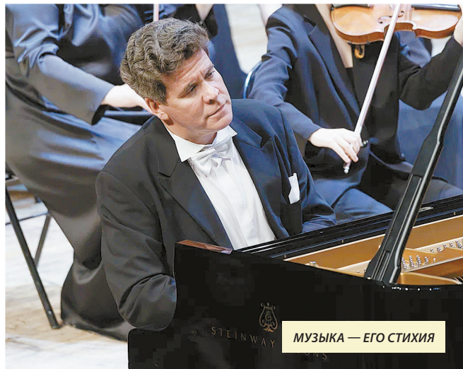
МУЗЫКА — ЕГО СТИХИЯ