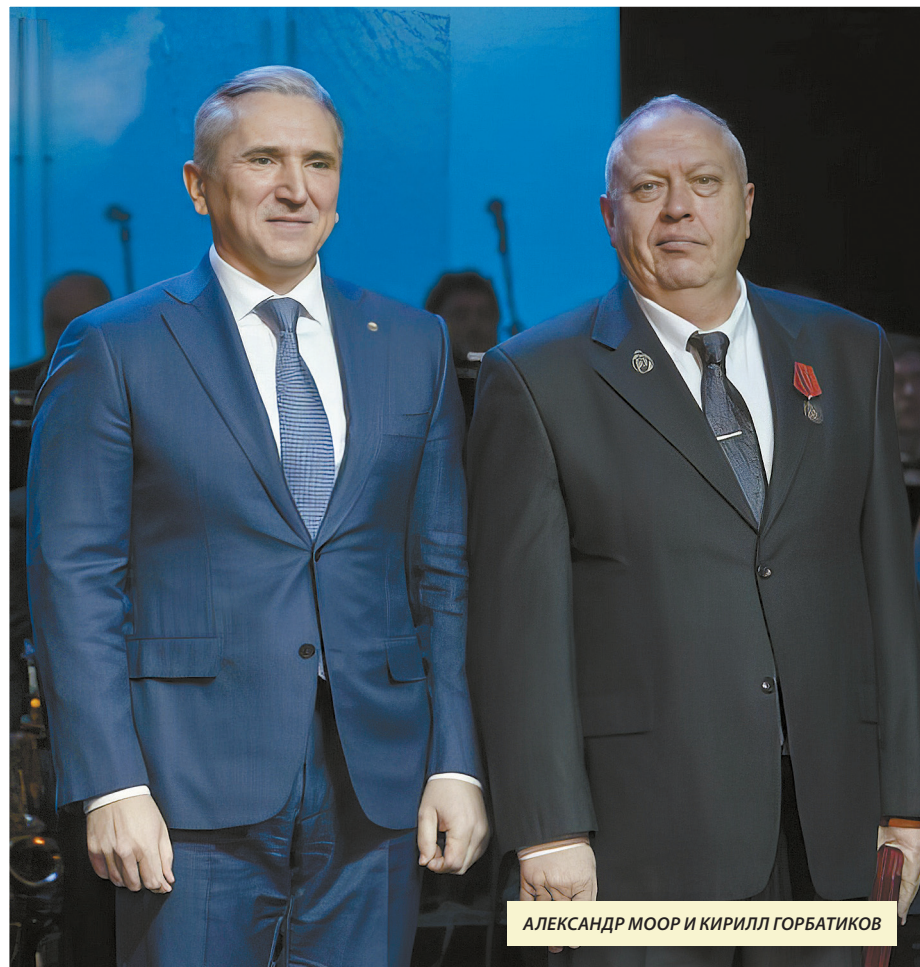
АЛЕКСАНДР МООР И КИРИЛЛ ГОРБАТИКОВ