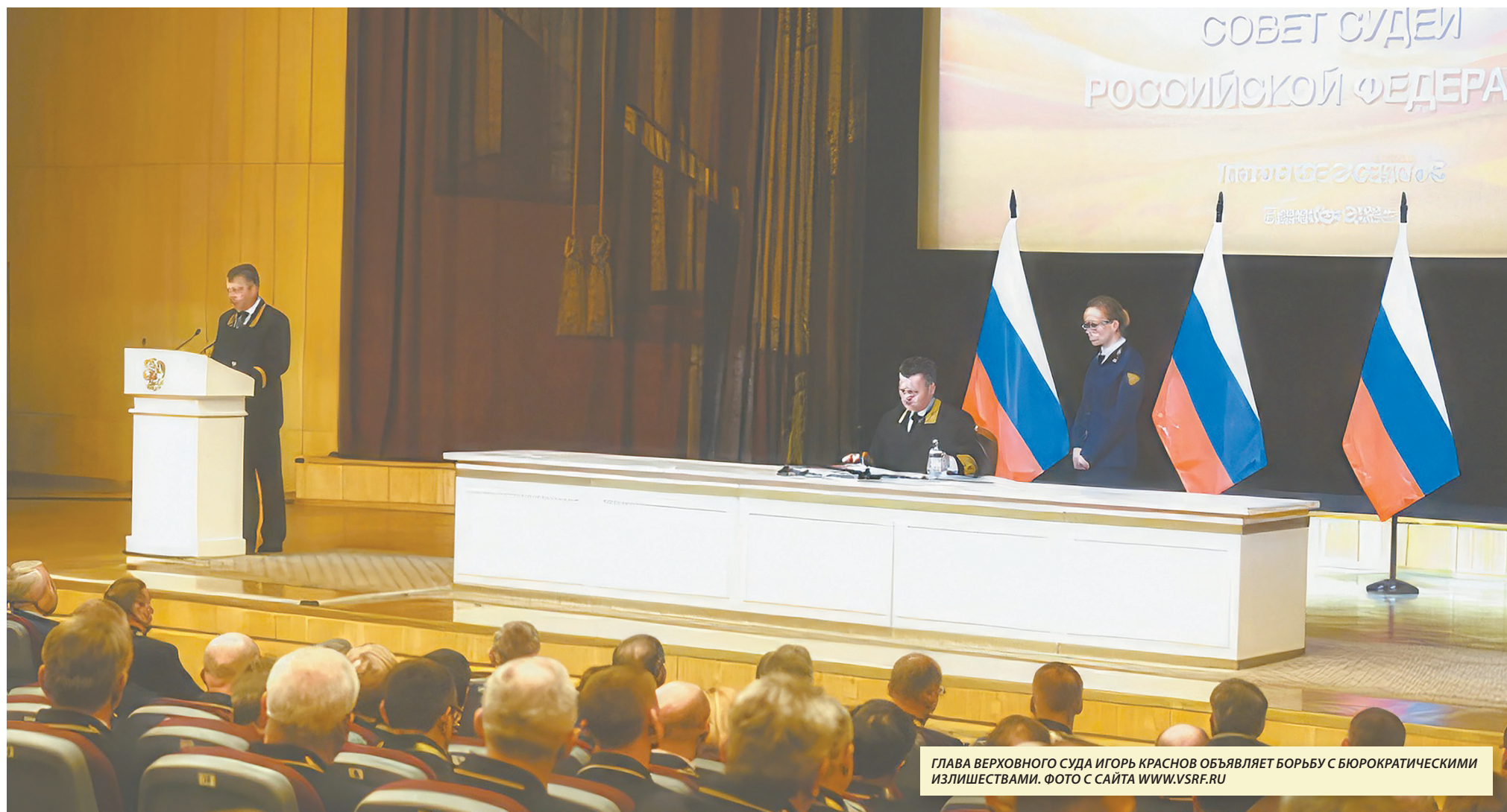
ГЛАВА ВЕРХОВНОГО СУДА ИГОРЬ КРАСНОВ ОБЪЯВЛЯЕТ БОРЬБУ С БЮРОКРАТИЧЕСКИМИ ИЗЛИШЕСТВАМИ.