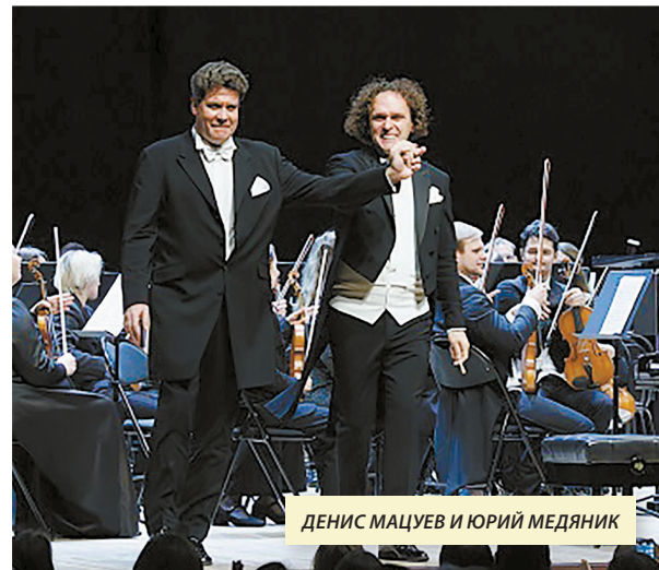
ДЕНИС МАЦУЕВ И ЮРИЙ МЕДЯНИК