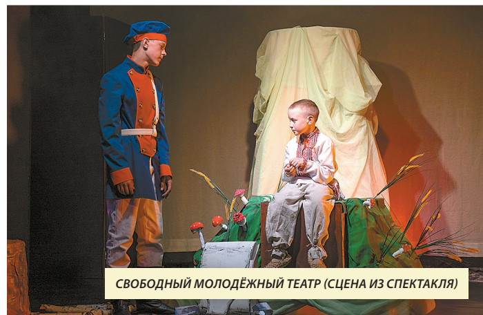
СВОБОДНЫЙ МОЛОДЁЖНЫЙ ТЕАТР (СЦЕНА ИЗ СПЕКТАКЛЯ)

В рамках благотворительной программы «Фор-мула хороших дел» ПАО «Сибур Холдинг» уже много лет развивает образовательное и культурное пространство в Тобольске. Тем самым увеличивает возможности реализации творческого потенциала местных жителей и работников профильных сфер. Яркий тому пример — Свободный молодежный театр, который из объединения любителей стал полноценным храмом Мельпомены.