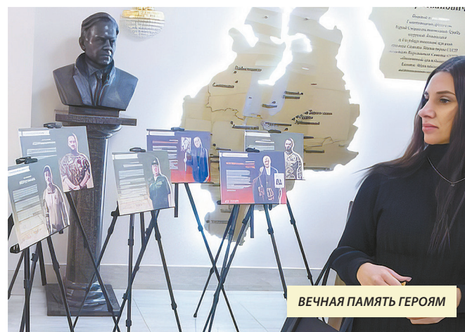
ВЕЧНАЯ ПАМЯТЬ ГЕРОЯМ